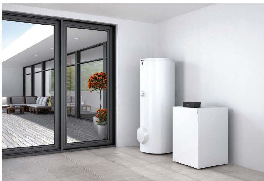
Siltumsūkņis "Vitocal 300-G" ar karstā ūdens tvertni "Vitocell 100-W"

Pateicoties modernai invertoru tehnoloģijai, zeme/ūdens siltumsūkņis "Vitocal 300-G" ir visefektīvākais risinājums jaunbūvēm un labākā izvēle iekārtas nomaiņas darījumā.