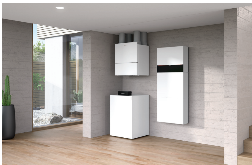
Energocentrāle, kurā ietilpst mājas ventilācijas sistēma "Vitovent 300-W", zeme-ūdens siltumsūkņis "Vitocal 300-G" un elektroenerģijas uzkrāšanas sistēma "Vitocharge VX3" (no kreisās puses)

Centrālā mājas ventilācijas iekārta "Vitovent 300-W" nodrošina visās telpās veselīgu mikroklimatu un patīkamu temperatūru.