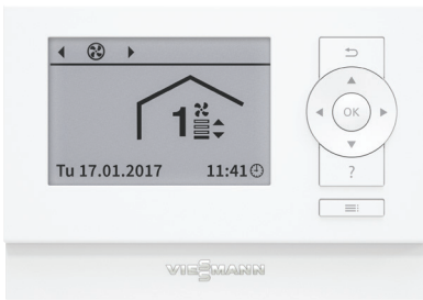
Ventilācijas vadības panelis (tips LB1)