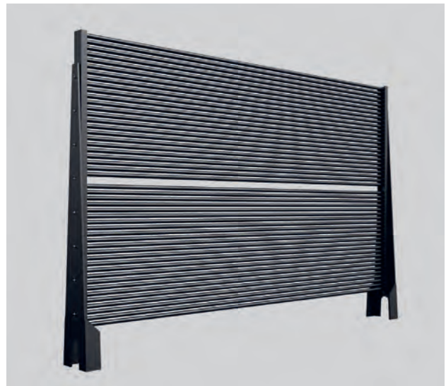
Solar-Luftabsorber (Energiezaun) als direkte Wärmequelle für die Wärmepumpe oder zur Regeneration des Eis-Energiespeichers

Ein weiterer Vorteil des Eis-Energiespeicher-Systems ist der Verzicht auf die sonst üblichen aufwendigen Bohrungen, um Erdwärme aus der Tiefe anzuzapfen. Auch entfallen umfangreiche Erdarbeiten, wie sie für das großflächige Verlegen von Erdkollektoren notwendig sind. Es entfallen auch behördliche Genehmigungen, da der Eis-Energiespeicher unkritisch für das Grundwasser ist.