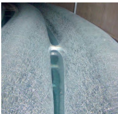
Eisbildung um den Wärmeübertrager im Eis-Energiespeicher

Besonders innovativ ist die Nutzung eines Eis-Energiespeichers als Energiequelle. Dabei handelt es sich um eine Zisterne mit eingebauten Wärmetauschern, die im Garten vergraben und mit normalem Leitungswasser befüllt wird. Im Garten wird an der Oberfläche ein Energiezaun aus Aluminium-Solar-Luftabsorbern angebracht, der Wärme aus der Umgebungsluft sowie aus der solaren Einstrahlung sammelt und diese der Wärmepumpe oder dem Speicher zuführt. Darüber hinaus bezieht der Eis-Energiespeicher Wärme direkt aus dem Erdreich.