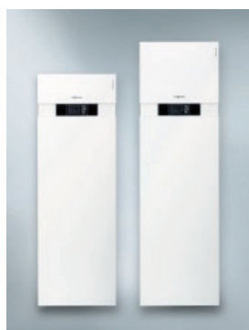
Vitocal 222-G (pa kreisi) Vitocal 242-G (pa labi)